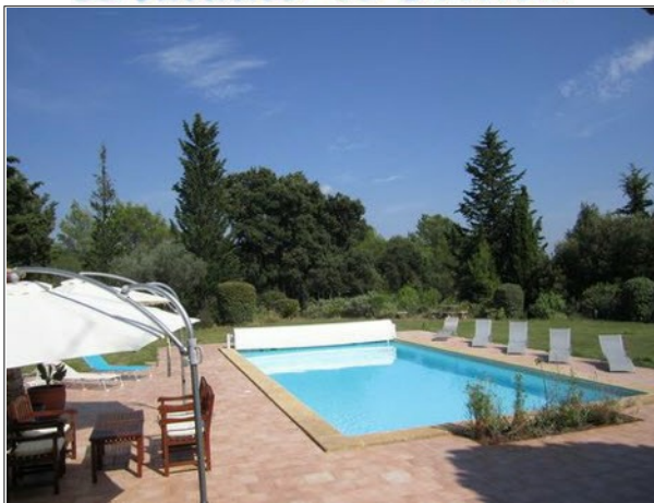
Piscine chauffée 12m x6, volet flottant sécurisé

Arrivée souhaitée 17 H 00/19 H 00 - Départ 10 H 00